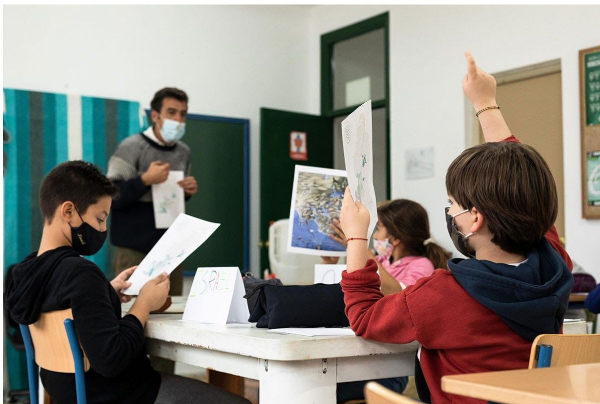
Taller Cartografía Crítica Creativa en CEIP Los Molinos, Beetime, Vejer 2020