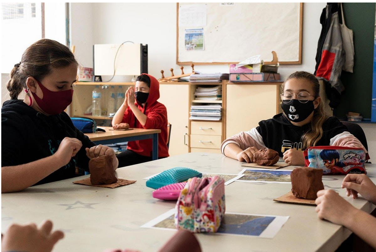
¿Qué hacemos cuando queremos conectar con nuestro lugar sagrado? Taller Cartografía Crítica Creativa en CEIP Los Molinos, Beetime, Vejer 2020

Llega el momento de introducir la pregunta fundamental: “¿Creéis que podemos tener una relación emocional con un lugar?”. Con las primeras respuestas y antes un posible enmudecimiento de la clase, desgranamos la cuestión: