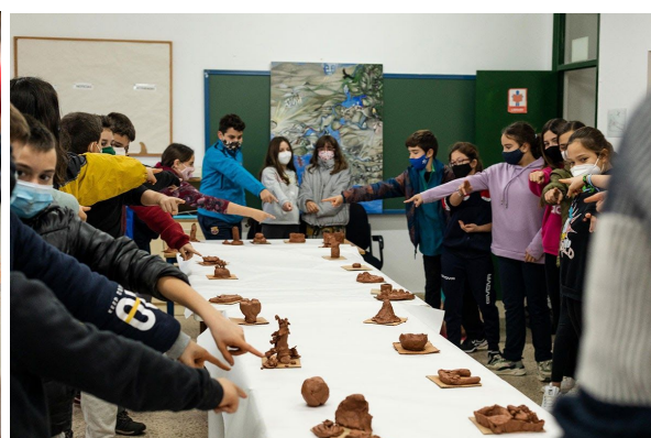
Taller Cartografía Crítica Creativa en CEIP Los Molinos y IES La Janda, Beetime Vejer 2020