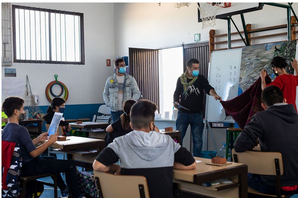
Taller Cartografía Crítica Creativa en SAFA Las Lomas, Beetime, Vejer 2020

Descubrimos el mapa mito-poético y observamos que se trata de otra representación de la misma realidad. Ahora volvemos a intentar localizarnos en el mapa, situarnos en él e intentar descifrar algunas de las historias que podemos intuir detrás de los símbolos. En nuestro caso empezamos por los vientos, el bosque cercano al nacimiento del río, la desaparecida laguna y el río mismo. Entonces dejamos que sean ellas y ellos los que lancen preguntas. Les trasladamos los motivos por los que los artistas representaron la realidad de esa manera y los invitamos a inventar sobre las figuras, posibles historias escondidas en su territorio.