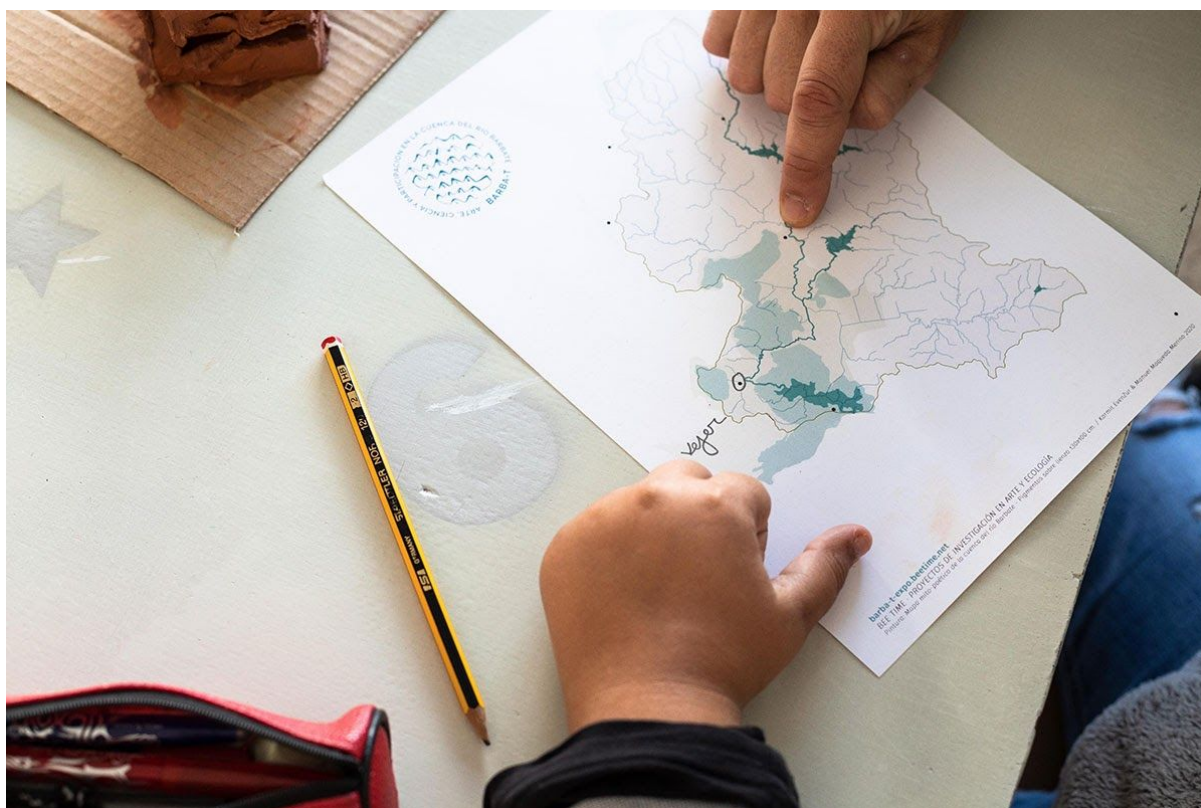
El reconocimiento de la cuenca del río Barbate, Taller Cartografía Crítica Creativa en CEIP Los Molinos, Beetime, Vejer 2020