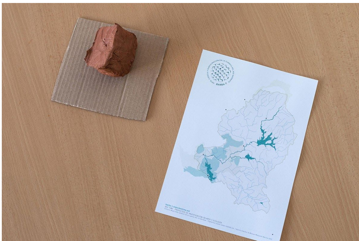
Taller Cartografía Crítica Creativa - Beetime 2020